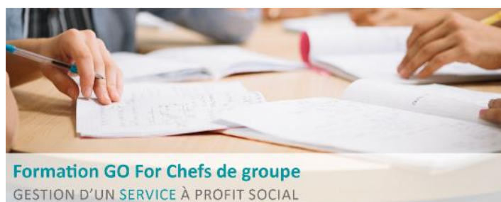
Formation GO For Chefs de groupe GESTION D'UN SERVICE À PROFIT SOCIAL

La formation se déroule à Namur de septembre 2019 à juin 2020. Prix: 90€/jour Infos